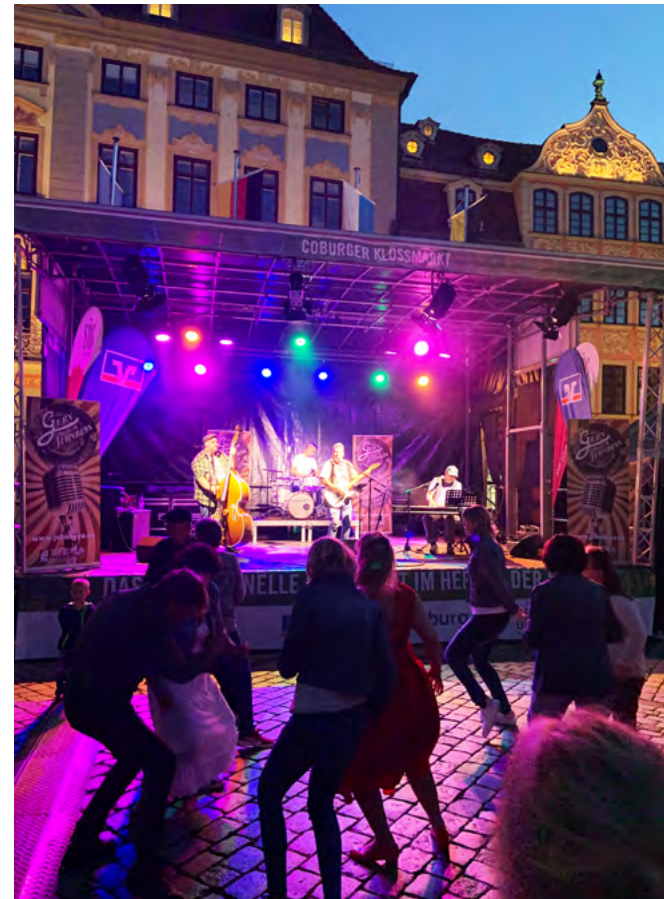
Impression aus 2022