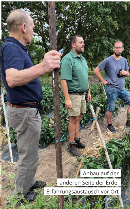
Anbau auf der anderen Seite der Erde: Erfahrungsaustausch vor Ort

Die vielen Eindrücke werden die drei wohl noch lange beschäftigen. Klar ist schon jetzt: Die Reise hat neue Ideen, Denkanstöße und Inspirationen gebracht – für Sorten, Anbaumethoden und Vermarktung. Und genau davon soll am Ende auch die Heimat profitieren: